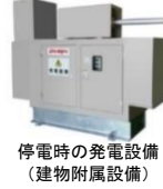
(中小企業経営強化税制の強化イメージ)